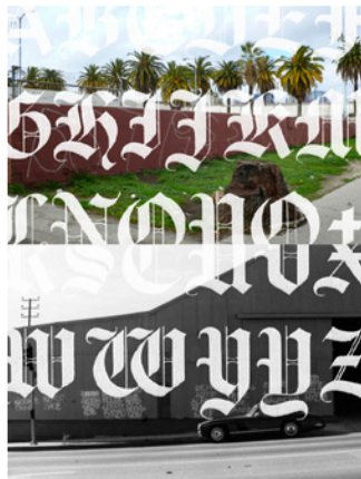
Downtown from 21st Street, Historic South Central, Los Angeles, photographie numérique couleur François Chastanet, 2008 Harbor City/Torrance, South Los Angeles, photographie argentique noir & blanc Howard Gribble, 1971 Modèle de lettres dit «Old English» issu d'un des très nombreuses rééditions de l'ouvrage Speedball Textbook de Ross F. George.