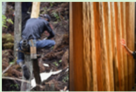
© François Azambourg, 2016, Benoît Jacquet, 2014.

11 | 2021 Penser l'architecture par la ressource