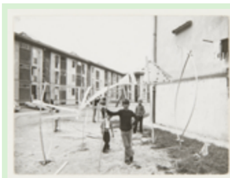
© FRAC Centre Val de Loire